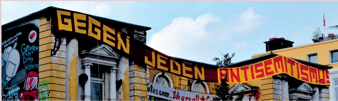
Gegen jeden Antisemitismus

den USA bei, kommen aber auch in linken Zusammenhängen vor und finden leichten Zugang zum Alltagsbewusstsein vieler Menschen. In diesem Workshop werden wir aktuelle Ausprägungen von Verschwörungstheorien betrachten und nach den Gründen fragen, die sie attraktiv machen. Dabei wird deutlich werden, warum Verschwörungsideologien zentral für den modernen Antisemitismus sind und warum sie jedem Gedanken an Emanzipation entgegenstehen.